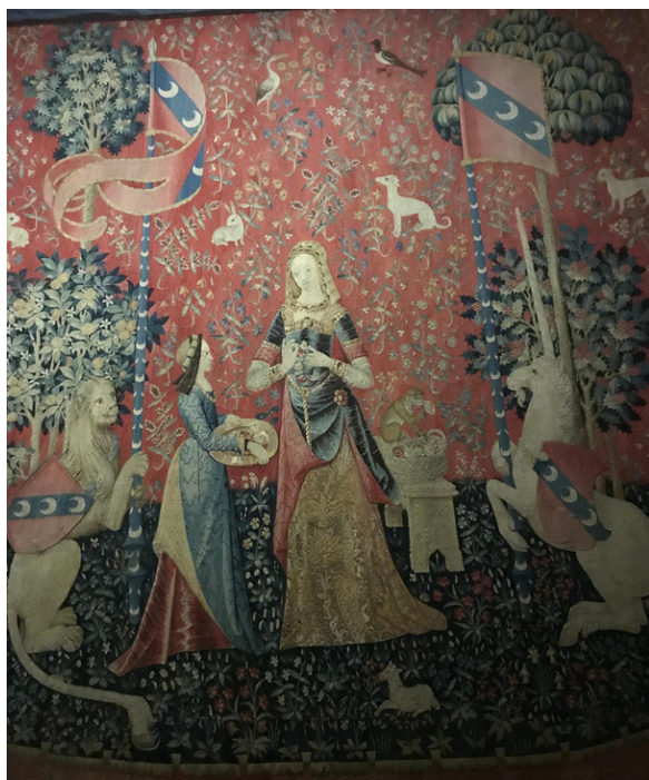
Photo 4 : La tapisserie de la Dame à la licorne représentant l'odorat.

Comme le musée du Moyen Âge est bâti sur les thermes de Lutèce, nous avons pu voir la plus belle œuvre du musée : la Dame à la licorne ! Cette œuvre date de la fin du Moyen Âge, et non de l'Antiquité romaine. Six tapisseries représentent les cinq sens (le toucher, le goût, l'odorat, l'ouïe, la vue) et un sixième sens, le choix ! La Dame à la licorne est un peu la Barbie dans l'imaginaire du Moyen Âge : seule la femme parfaite pouvait toucher une licorne, car la licorne empalait les gens le plus souvent avec sa corne. La tapisserie peut se lire dans les deux sens et on peut apercevoir sur chaque tapisserie un petit singe qui représente l'un des sens.