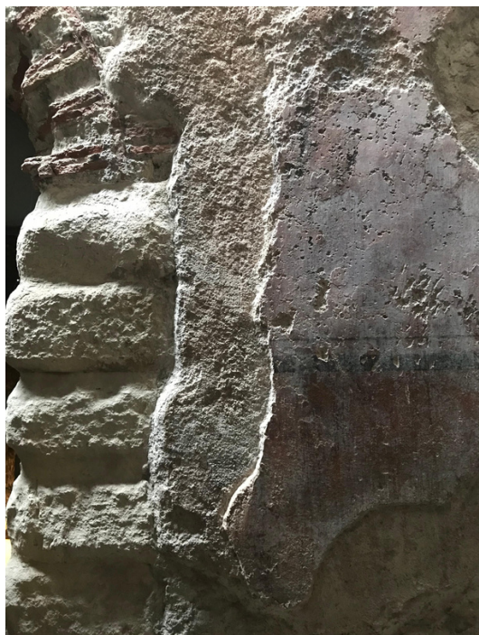
Photo 3 : Les différentes couches des murs (vestiges des murs du sous-sol).

Deuxièmement, les esclaves étaient souvent affranchis dans l'Empire romain : s'ils l'étaient, ils connaissaient ainsi un minimum la culture romaine, et cela participait à la romanisation de la Gaule.