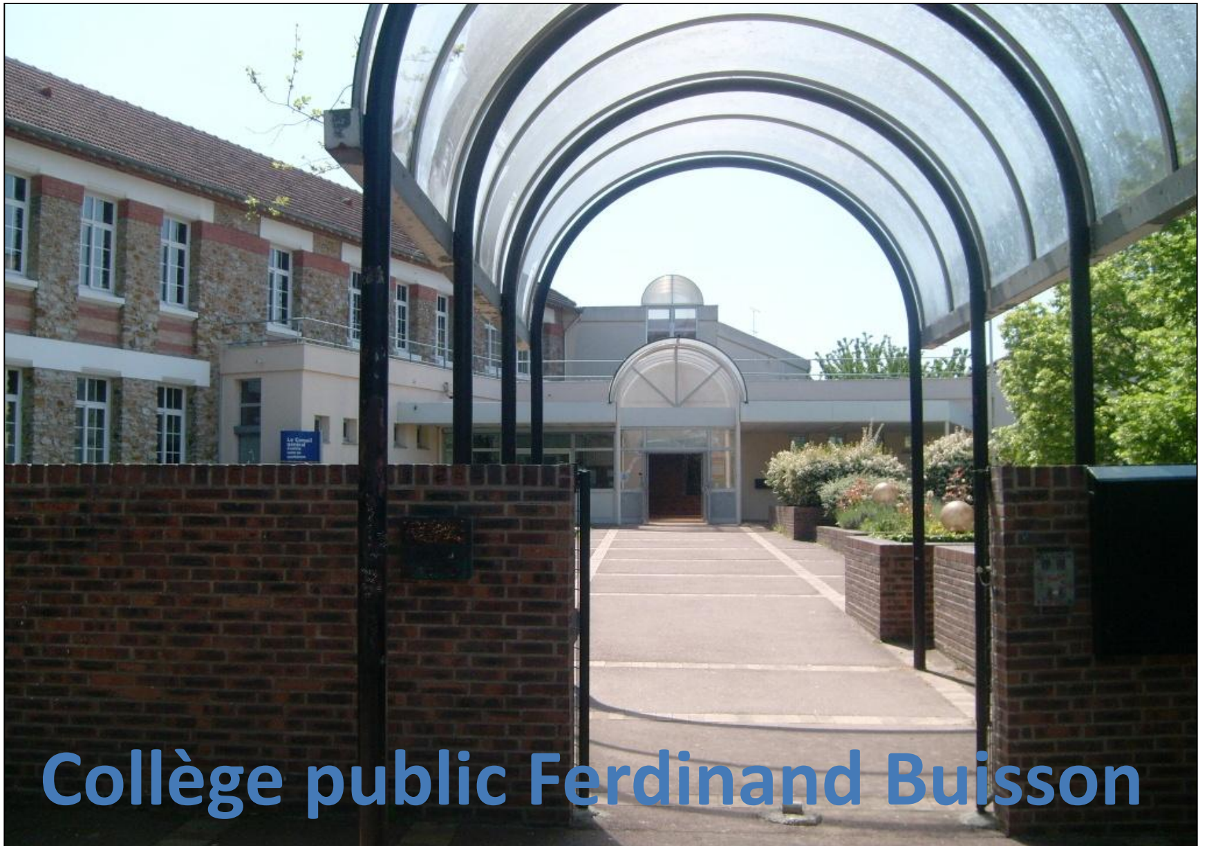
Collège public Ferdinand Buisson